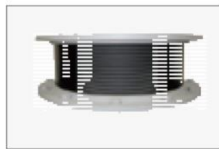
積層ゴム (参考写真)