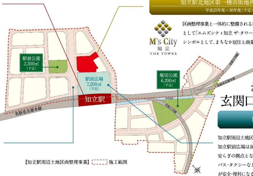
【知立駅周辺土地区画整理事業】 〰〰〰 施工範囲

鉄道の高架化事業に合わせて魅力ある街づくりが進行中。「エムズシティ知立ザ・タワー」の西側には、エリアのメインストリートとなる幅員約30メートル道路が整備される予定です。