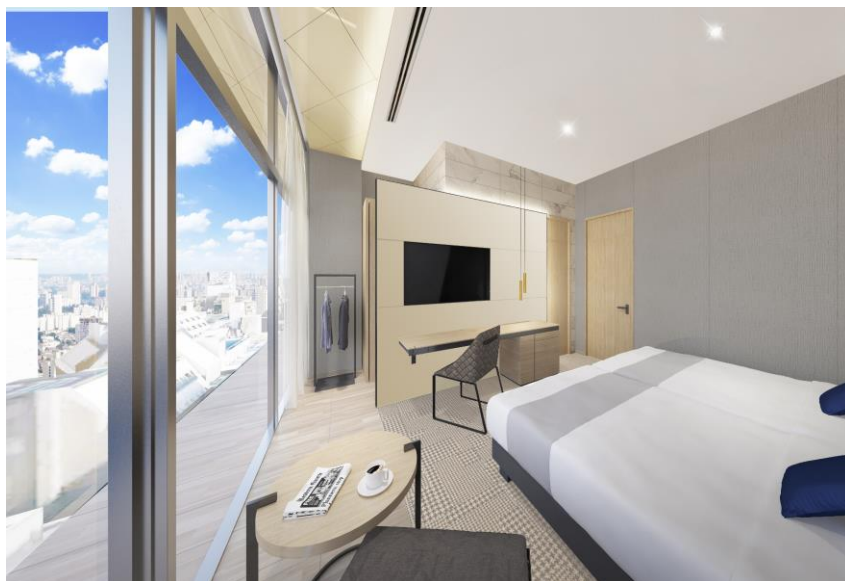
13階客室「ミュッセツイン」イメージ図

さらに、女性にも気兼ねなくご宿泊いただけるよう、専用カードキー以外では入ることができない女性専用区画を設置しました。